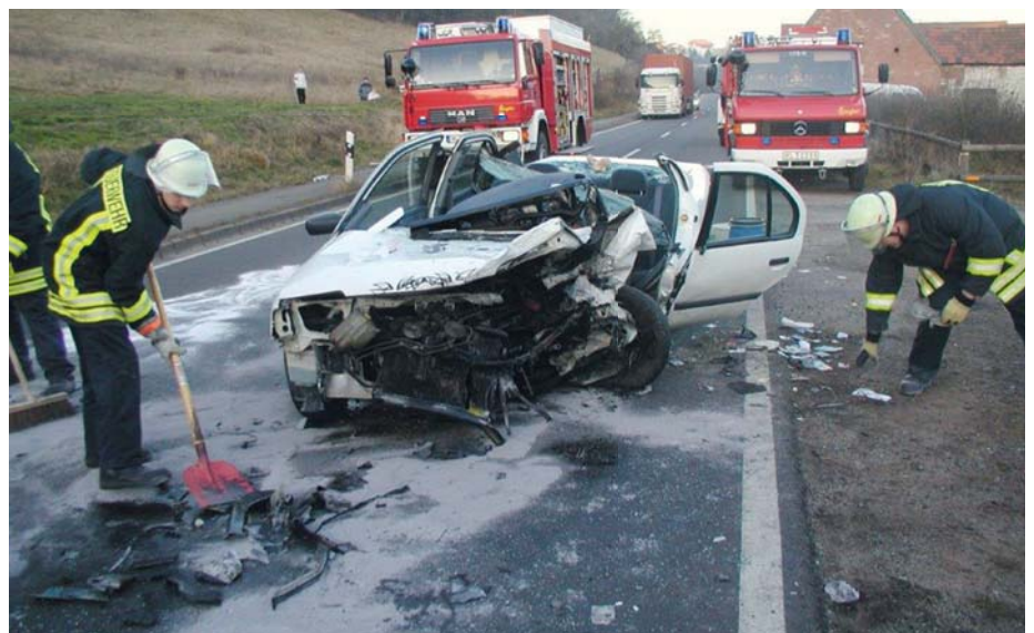
Ein typischer Abrechnungsfall: die Feuerwehr erbringt technische Hilfeleistungen nach einem Verkehrsunfall.

Es ist nicht empfehlenswert, sich auf einen langwierigen Streit mit der Versicherung bzw. deren Schadensgutachtern einzulassen. Denn dies verursacht einerseits einen nicht unerheblichen Verwaltungsaufwand; andererseits wird man den Versicherungssachbearbeiter bzw. den Schadensgutachter zumeist nicht von seiner Rechtsansicht abbringen können. Hinzu kommt, dass die Versicherung nicht